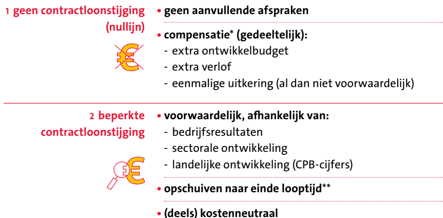
Tabel 2: Mogelijke invulling van de loonparagraaf in nieuwe cao's

* Maatwerk: werkgever kan bepalen welke bedrijven/bedrijfsonderdelen extra verlof of een eenmalige uitkering krijgen